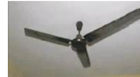
कोलकाता में इस महीने दूसरी बार भूकंप

पश्चिम बंगाल की राजधानी कोलकाता सहित कई जिलों में शुक्रवार दोपहर करीब 1.30 बजे भूकंप के झटके महसूस किए गए। जानकारी के मुताबिक, भूकंप का केंद्र बांग्लादेश के ढाका स्थित अग्रगांव में था। रिक्टर स्केल पर इसकी तीव्रता 5.3 मापी गई। पश्चिम बंगाल से अग्रगांव की दूरी लगभग 26 किलोमीटर बताई जा रही है। झटके इतने तेज थे कि कोलकाता में बहुमंजिला इमारतें कुछ सेकेंड तक हिलती रहीं। अचानक कंपन महसूस होते ही लोग घरों और दफ्तरों से बाहर निकल आए। कोलकाता के अलावा हावड़ा, हुगली, झाड़ग्राम और पश्चिम मेदिनीपुर जिलों में भी लोगों के बीच दहशत का माहौल बन गया। कई इमारतों में बंद पड़े सीलिंग फैन तक हिलते नजर आए। कुछ पुराने मकानों के झुकने की भी खबर सामने आई है। हालांकि अब तक बड़े नुकसान की पुष्टि नहीं हुई है। कोलकाता में स्वगता नाम की ने