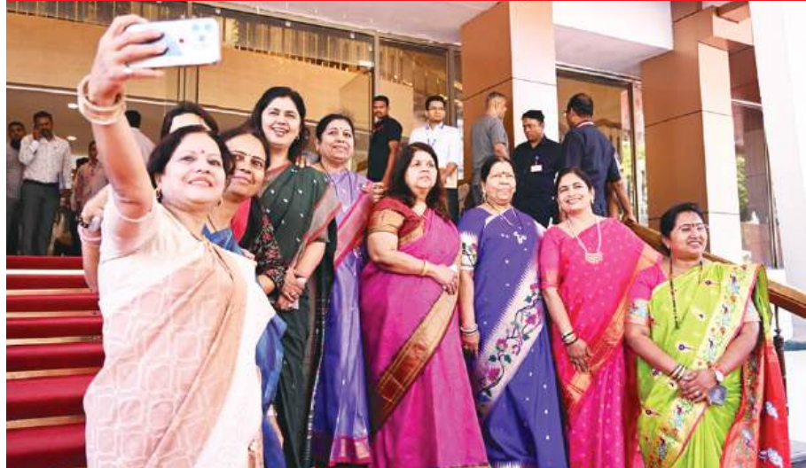
महाराष्ट्र विधान भवन की सीढ़ियों पर एक यादगार पल। कैबिनेट मंत्री पंकजा मुंडे के साथ अन्य महिला विधायक साढ़ियों में सेल्फी निकालते हुए।