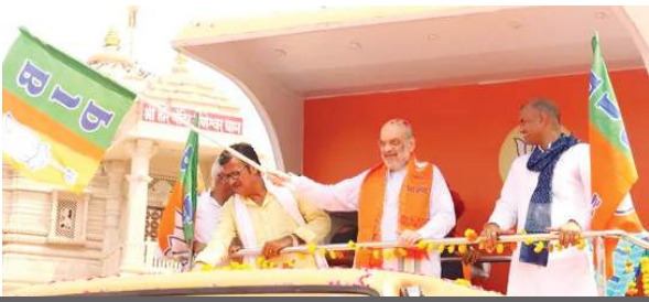
दो मार्च को शाह आएंगे कोलकाता

इस राजनीतिक शक्ति प्रदर्शन में केंद्रीय मंत्रियों और दिग्गज नेताओं का जमावड़ा लगने वाला है। विशेष रूप से, केंद्रीय गृह मंत्री अमित शाह के कार्यक्रम में मामूली बदलाव हुआ है, अब वे एक मार्च की बजाय दो मार्च को दक्षिण 24 परगना जिले के रायदिही से इस यात्रा का शुभारंभ कर सकते हैं। भाजपा ने पूरे राज्य को 10 सगठनात्मक संभागों में बांटा है, जिनमें से नौ संभागों में यह यात्रा निकलेगी। कोलकाता संभाग को इस यात्रा से मुक्त रखा गया है क्योंकि वहां 14 मार्च को होने वाली ब्रिगेड रैली की तैयारियां चल रही हैं, जिसे प्रधानमंत्री नरेन्द्र मोदी संबोधित करेंगे।